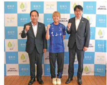
左から新井飯能市長、橋沼選手、田村社長

問い合わせ スポーツ課 TEL972-6028 FAX971-2393 ✉taiiku@city.hanno.lg.jp