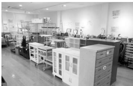
令和5年のリユース品販売会の様子