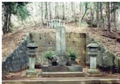
飯能市指定記念物 史跡 黒田直邦の墓

直邦は能仁寺の再興に尽力し、後に黒田家も能仁寺を菩提寺とし墓所を造営します。黒田直邦の墓は多峯主山頂直下であり、黒田領となった父方の中山氏伝来の地を見守るかのようです。