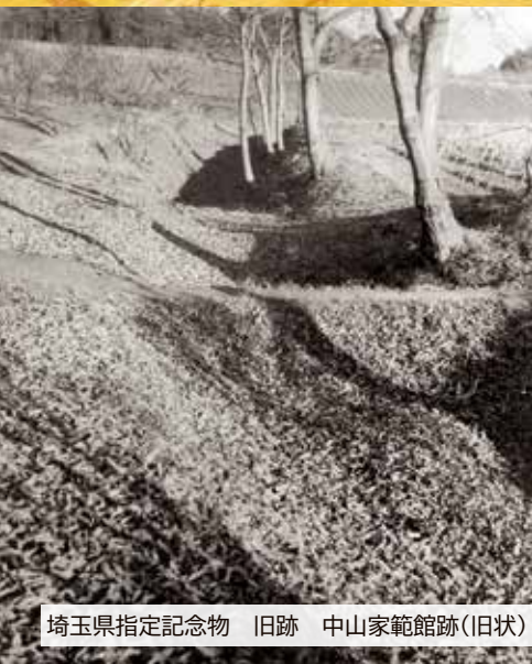
埼玉県指定記念物 旧跡 中山家範館跡(旧状)

中山地内には中山家範館跡のほか、智観寺の境内に智観寺板石塔婆、中山信吉墓、中山信吉木碑があります。中山氏の中山家範の子の一人、信吉は現在の茨城県域などの一部に相当する水戸藩の付家老に出世しました。智観寺は信吉系統の中山家の菩提寺で、墓所とゆかりの寺宝が数多くあります。