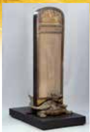
埼玉県指定有形文化財 書跡・古文書 中山信吉木碑