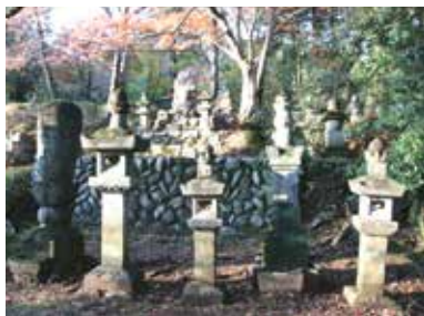
飯能市指定記念物 史跡 能仁寺中山勘解由三代の墓

天覧山麓の能仁寺は中山氏が開いた寺院です。中山氏の名家である家範の子の一人、照守の系統の菩提寺で、能仁寺中山勘解由三代の墓があります。