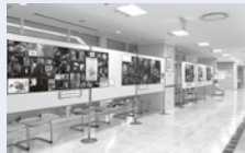
令和5年度DV防止週間展(市民活動センター)の様子