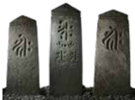
埼玉県指定有形文化財 考古資料 智観寺板石塔婆

天覧山麓の能仁寺は中山氏が開いた寺院です。中山氏の名家である家範の子の一人、照守の系統の菩提寺で、能仁寺中山勘解由三代の墓があります。