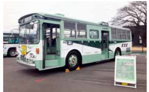
令和6年2月に開催したバスまつりの様子