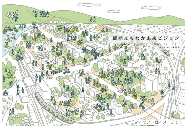
※イラストはイメージです。