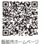
飯能市ホームページ

スゴ足イベント 歩こう、飯能。目指せウオーキング人口3万人!! 子どもから高齢者まで幅広い世代で取り組める健康づくりとしてウオーキングを推奨しています。イベントに参加して楽しみながらウオーキングの輪を大きくしていきましょう! ①第28回なぐりの里ウオーク 日 3/3 (日) 名栗地区行政センター 8:45(約9.6km、約3時間30分) ②第11回菜の花ウオーク 日 4/6 (土) 双柳地区行政センター 8:30(約7km、約2時間30分) ③飯能ツーデー「吾野コース」を歩く 日 4/17 (水) 西武線吾野駅改札口前9:45(約25km、約6時間) ※コースなどの詳細は「スゴ足イベントのホームページ」をご覧ください。イベントごとに問い合わせ先等が異なります。