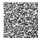
シンポジウム電子申請