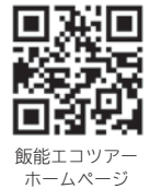
飯能エコツアーホームページ

飯能市エコツーリズム 春のエコツアー一覧 問日時・料金・申し込み先等の詳細は飯能エコツアーホームページまたは「飯能エコツアー2024・春号」を確認してください。申し込みの際は、氏名・連絡先・年齢・参加人数を伝えてください。費用にはガイド代、昼食代、保険代などが含まれますが、ツアーにより異なります。申込後、参加者の都合によりキャンセルした場合、事前の食材準備や、機材の手配等によりキャンセル料が発生する場合があります。