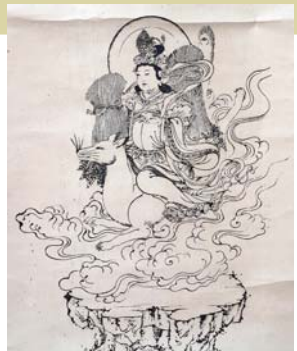
とよかわだきにんてん 豊川吒枳尼眞天 (掛軸部分)

日3/17(日)~5/12(日) 社寺より配札されるお札(護符)の中には、「絵札」「御影」と呼ばれる神仏の図像を墨摺りや印刷したものがあります。博物館が所蔵する神仏の図像を示したお札や掛け軸を展示します。 ※直接博物館へ