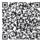
飯能まちなか未来ビジョン

ビジョンの実現に向けて、市民・事業者・行政等が一体となった公民連携による持続可能なまちづくりを推進していきます。二次元コードからは、飯能まちなか未来ビジョンがご覧いただけます。