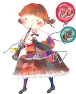
イラスト：松枝 晶子