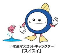
下水道マスコットキャラクター「スイスイ」