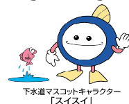
下水道マスコットキャラクター 「スuisui」

◇問合せ 下水道課 TEL：973-3433/FAX：973-3651/E-mail：gesui@city.hanno.lg.jp