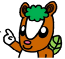
飯能市イメージキャラクター 夢馬（むーま）