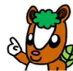
飯能市イメージキャラクター 夢馬 (むーま)