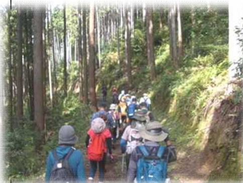
地域を歩こう！ 【愛宕山～瀧泉寺】