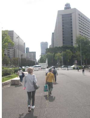
大人の社会科学見学 【首都圏の台所である豊洲市場と 首都の治安を守る警視庁へ】