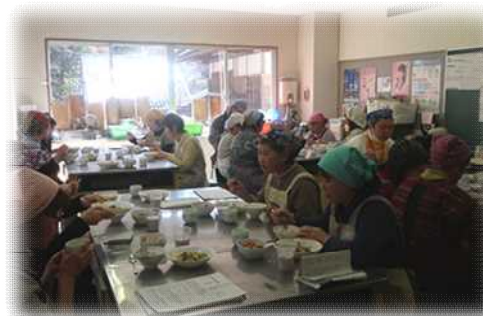
脳活料理教室 【脳にやさしい料理教室】