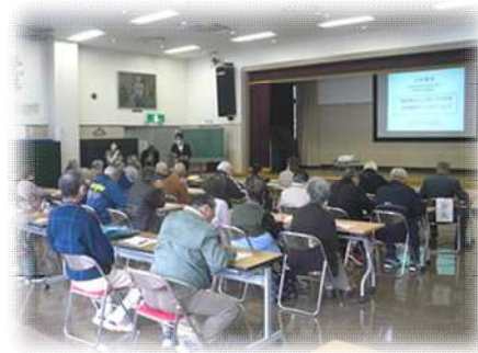
生活お役立ち講座 【介護保険制度のしくみ】