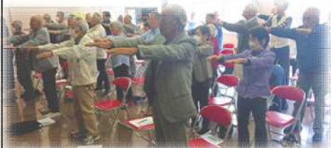
高齢者学級 【目指せ！健康長寿】