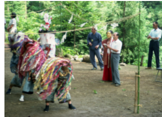
高山の獅子舞 (休止中)