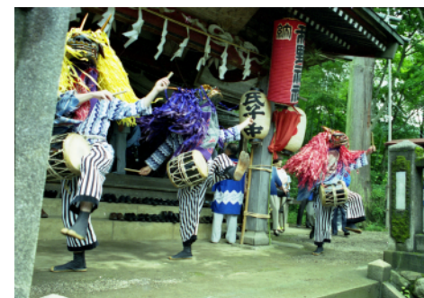
三社の獅子舞（一人立ち三匹獅子舞）

飯能市内には、一人立ち三匹獅子舞が9ヶ所、二人立ち太神楽系獅子舞が1ヶ所で传承されています。なお、下名栗の獅子舞が埼玉県、他は飯能市の無形民俗文化財に指定されています（高山の獅子舞をのぞく）。