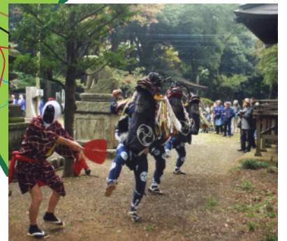
飯能諏訪八幡神社の獅子舞