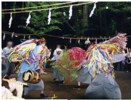
南川の獅子舞 しょうまる