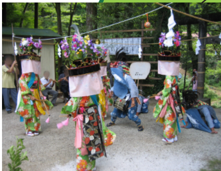
檜瀨諏訪神社の獅子舞