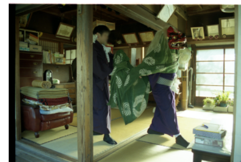
石原の獅子舞（二人立ち太神楽系獅子舞）