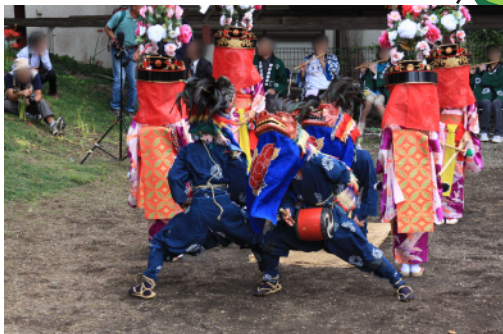
星宮・諏訪神社の獅子舞