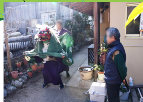
石原の太神楽獅子舞