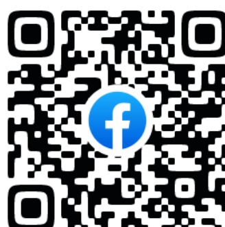
飯能市社会福祉協議会 Facebookページ