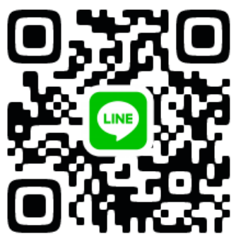
飯能市社会福祉協議会 LINE公式アカウント