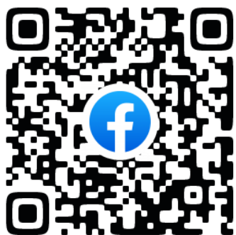
はんのう・みんな食堂 Facebookページ