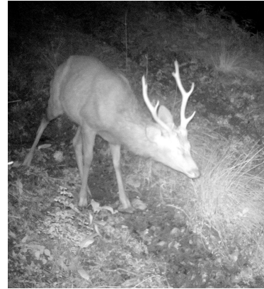
モニタリングの様子