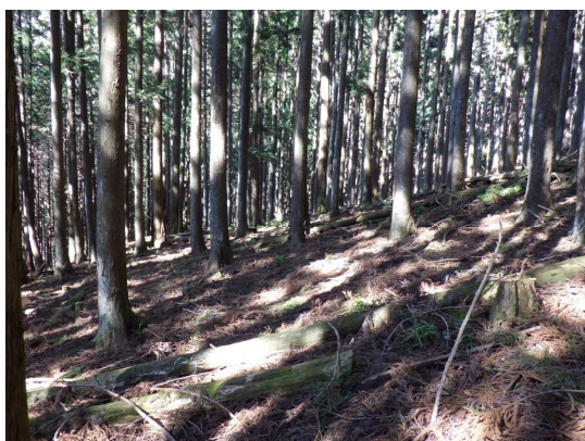
手入れ不足の様子

令和8(2026)年度についても、企業からの寄附金（企業版ふるさと納税）や埼玉県補助金（水源地域保全等支援交付金）などを活用しながら、引き続き同様の取組を進めてまいります。