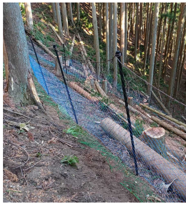
シカ害対策の様子