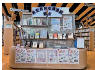
令和7年度の特別展示の様子