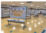
令和7年度のパネル展の様子